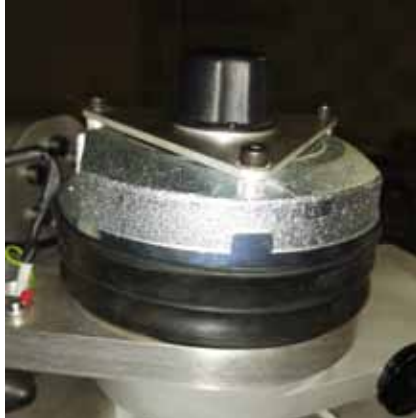
Frein de blocage électrique des axes de pivot.