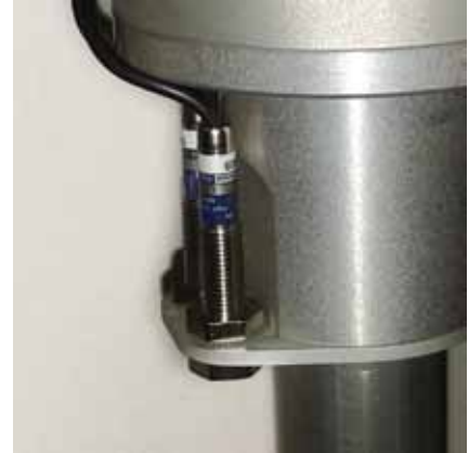
Présence main à capteur optique sur la gouverne.

Sur demande il est possible de modifier certaines caractéristiques dimensionnelles du cobot 1A-100 pour mieux répondre aux exigences de votre cas d'application. La forme et l'ergonomie du 2 ème segment voire de la gouverne peuvent être adaptées au besoin. Implantation sur potence, suspendu ou sur base mobile.