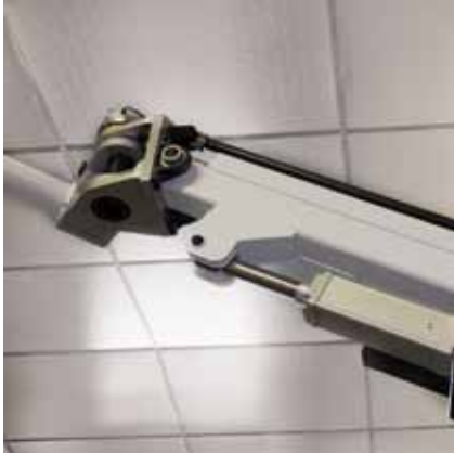
Vérin électrique à servo moteur.